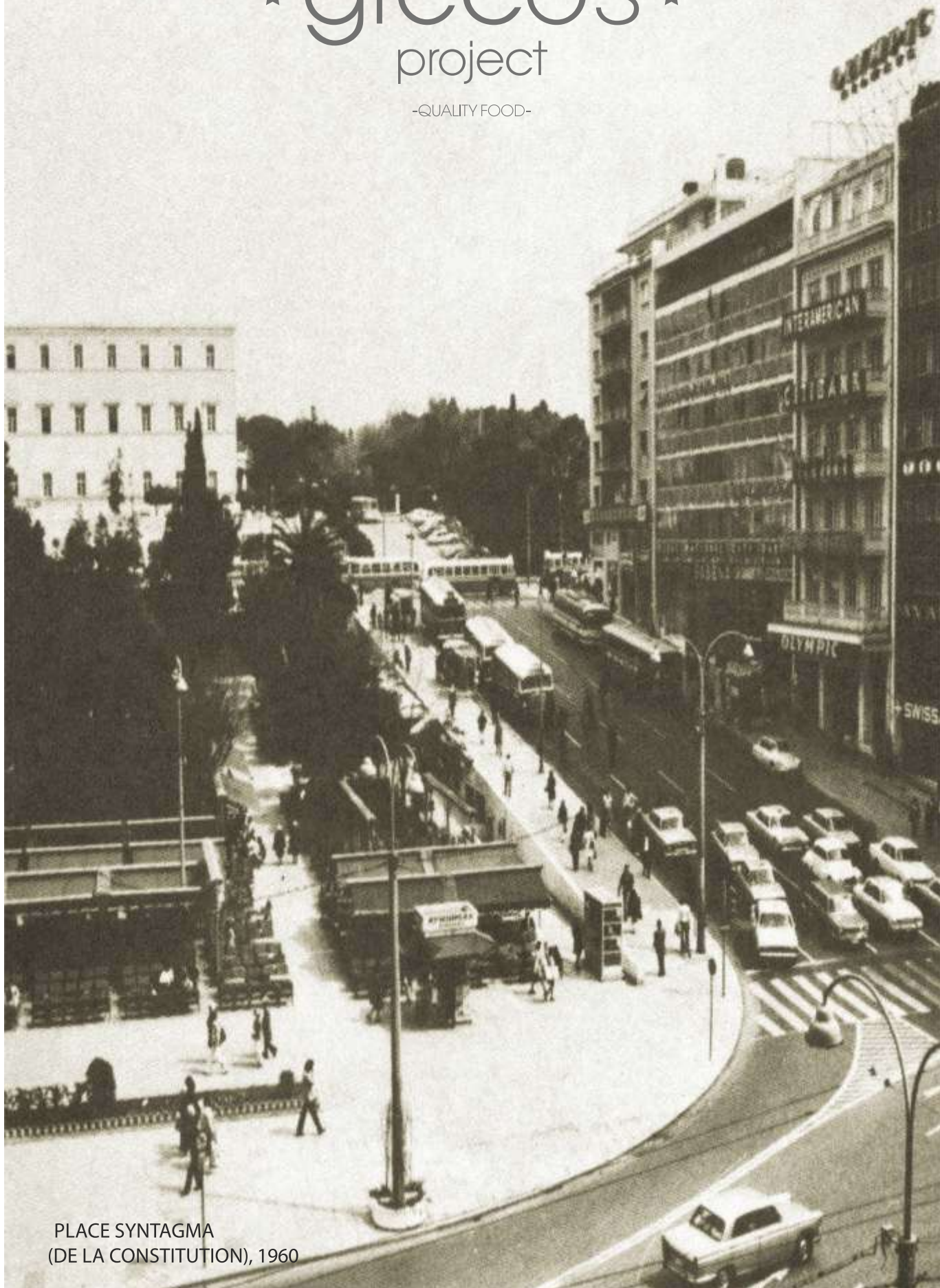
PLACE SYNTAGMA (DE LA CONSTITUTION), 1960